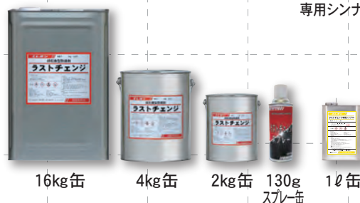
16kg缶 4kg缶 2kg缶 130gスプレー缶 1ℓ缶